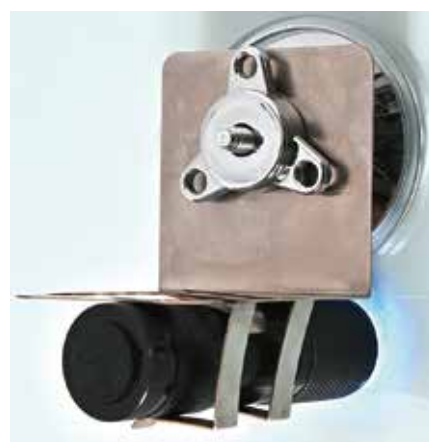
製品内容：ランプ本体・治具・強力吸盤