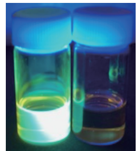
リークマン 他社 UV照射後