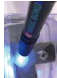
MB5(屋外用) 5本 / 袋