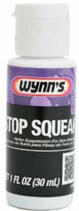
ディスクブレーキ装置

Wynn's「SS」は新しいパッドに交換した時だけでなくすでに取付けられているパッドの溝や穴を埋める修理目的としてもご使用下さい。