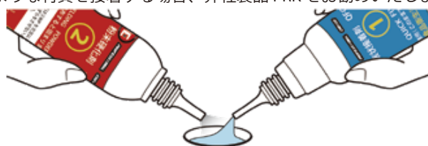
①液状(高分子液状接着剤)+②粉末(ウェルディングパウダー)